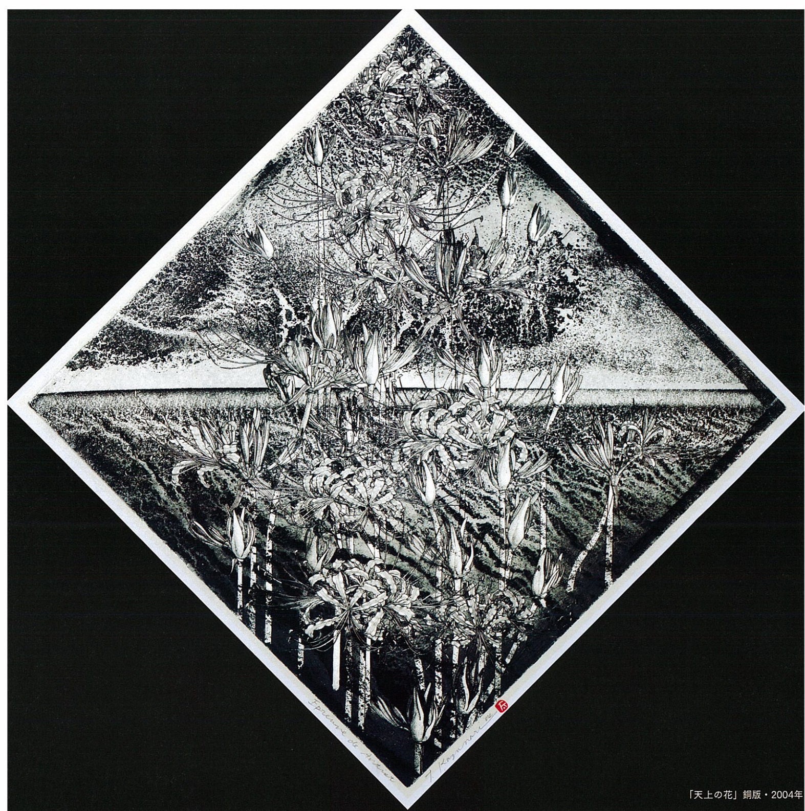
「天上の花」銅版・2004年