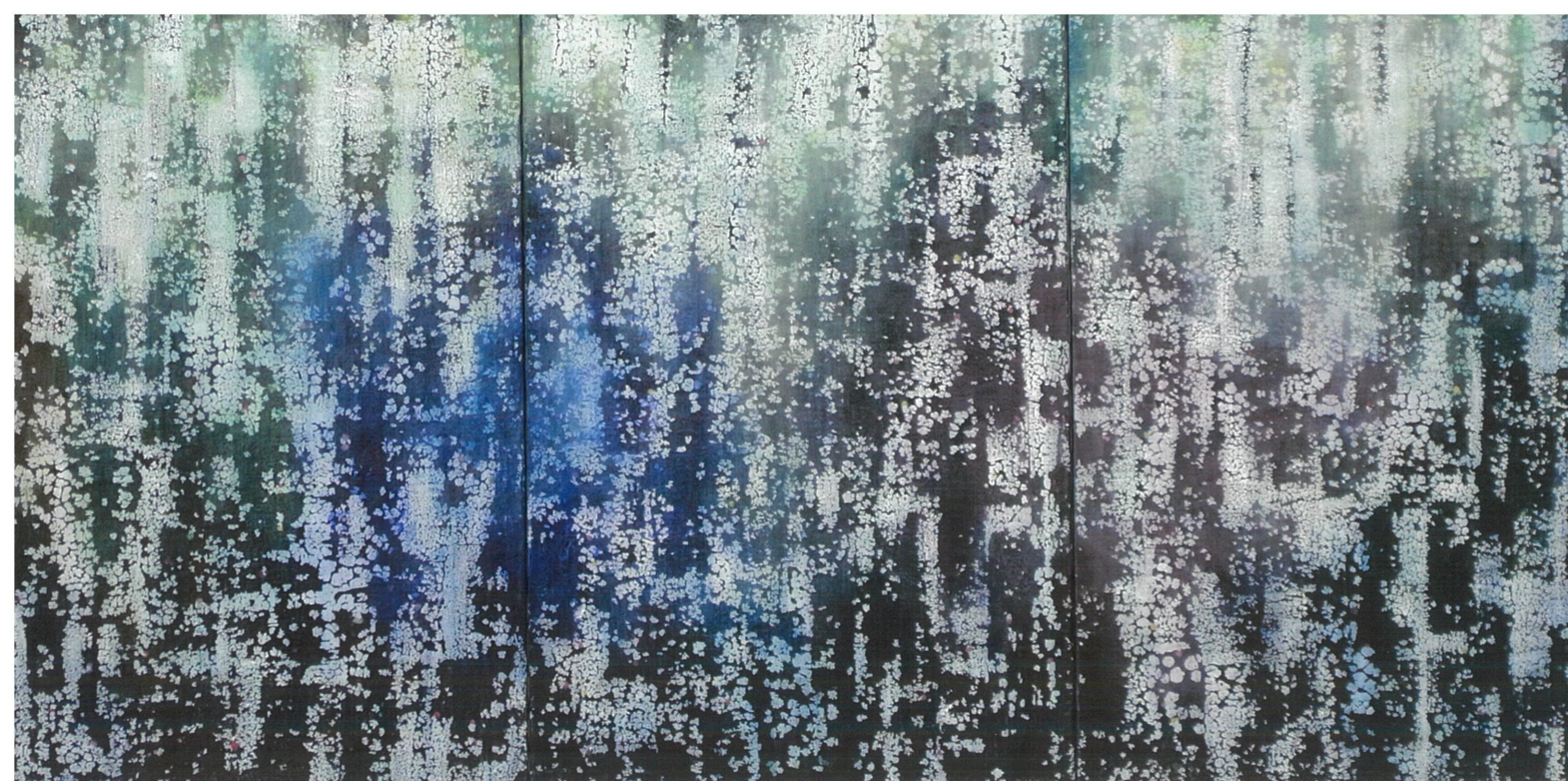
心象オーロラ Impression boréale triptyque / 2017