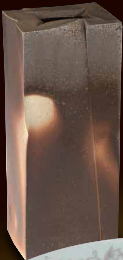
角花生 伊勢崎 淳 重要無形文化財保持者