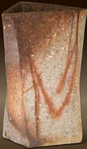
高島屋賞(優秀賞) 自然練込花器 豊福 博