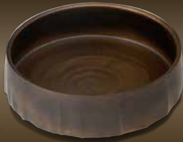
月煌彩器 坂倉 善右衛門