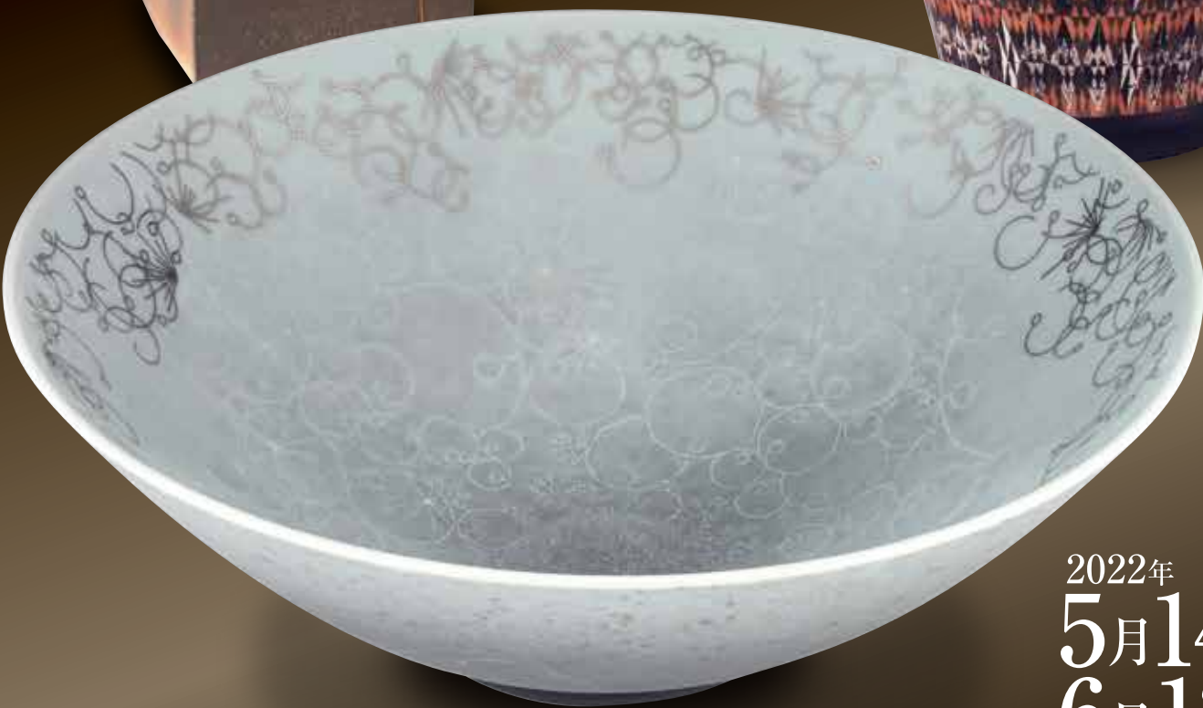
色絵薄墨墨はじき石路文鉢 今泉 今右衛門 重要無形文化財保持者