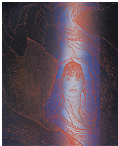
《あの日》1976年 銅版画 加計せせらぎ美術館所蔵