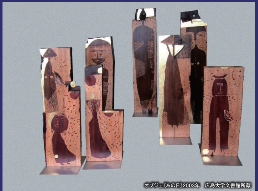
オブジェ《あの日》2003年 広島大学文書館所蔵