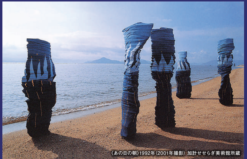
《あの日》の朝 1992年 (2001年撮影) 加計せせらぎ美術館所蔵