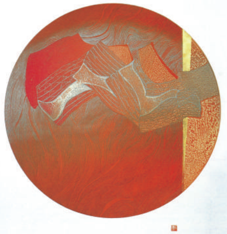
《空からの手紙B》1995年 銅版画 加計せせらぎ美術館所蔵