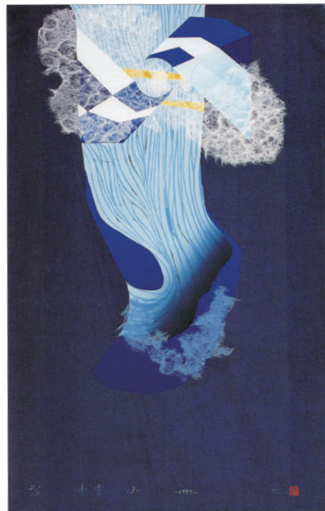
《水雲3》1992年 シルクスクリーン・和紙・藍染 加計せせらぎ美術館所蔵