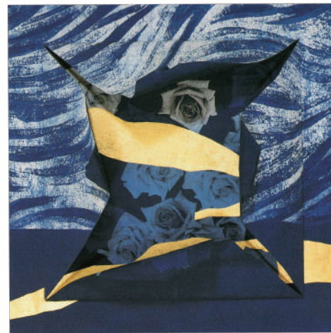
《輝け太陽5》1991年 藍染・額入 加計せせらぎ美術館所蔵