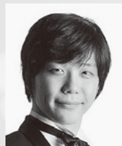
藤本 宏平 ピアノ

帰国後は、群馬交響楽団をはじめ、東京シティフィル、名古屋フィル、大阪フィル、広島交響楽団、札幌交響楽団等、日本各地のオーケストラを指揮している。またオペラでは『フィガロの結婚』や『椿姫』、『こもり』や『御柱』など幅広い演目を、バレエでは『白鳥の湖』や『くるみ割り人形』、『ドン・キホーテ』などを指揮している。2003年には、ハイドンのオペラ『無人島』で新国立劇場に初登場した。