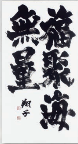
《福聚海無量》令和2(2020)年発表

金澤翔子氏は世界的に活躍する祈りの書家です。昭和60(1985)年東京都に生まれ、5歳より母泰子氏に師事して書を始めます。20歳のときに銀座書廊で初めて開いた個展が評判を呼び、以来、全国各地の神社仏閣で奉納揮毫を行うほか、国内外で数多くの個展を開催しています。また国連本部での日本代表としてのスピーチや文部科学省のスペシャルサポーター大使など、その活躍は多岐にわたっています。 本展では「書に親しむ人にも、初めて触れる人にも書をお届けしたい」との思いを込めて、令和2(2020)年に、台湾で開催した展覧会の出品作を広島県内で初めて公開します。さらには、平成の代表作である「心に光を」(平成25年)をはじめ、東京2020公式アートポスターの金箔原画「翔」(令和2年)やNHK大河ドラマ「平清盛」のポスター(平成23年)など、令和の近作から平成の代表作までの40点を超える大作をご覧いただけます。デジタル化が進む中で毛筆を手にする機会が減っている今、改めて書の魅力を感じていただければ幸いです。