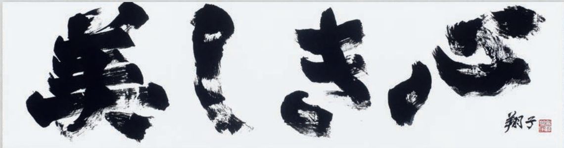
《美しき心》令和2(2020)年発表