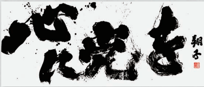
《心に光を》平成25(2013)年発表