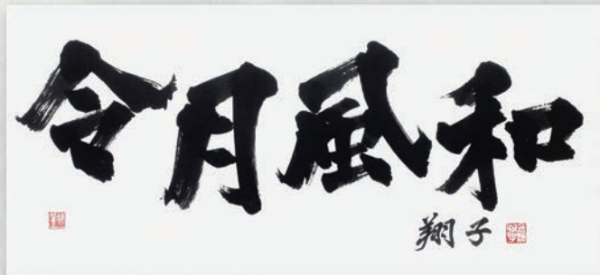
《令月風和》令和2(2020)年発表

金澤翔子氏は世界的に活躍する祈りの書家です。昭和60(1985)年東京都に生まれ、5歳より母泰子氏に師事して書を始めます。20歳のときに銀座書廊で初めて開いた個展が評判を呼び、以来、全国各地の神社仏閣で奉納揮毫を行うほか、国内外で数多くの個展を開催しています。また国連本部での日本代表としてのスピーチや文部科学省のスペシャルサポーター大使など、その活躍は多岐にわたっています。 本展では「書に親しむ人にも、初めて触れる人にも書をお届けしたい」との思いを込めて、令和2(2020)年に、台湾で開催した展覧会の出品作を広島県内で初めて公開します。さらには、平成の代表作である「心に光を」(平成25年)をはじめ、東京2020公式アートポスターの金箔原画「翔」(令和2年)やNHK大河ドラマ「平清盛」のポスター(平成23年)など、令和の近作から平成の代表作までの40点を超える大作をご覧いただけます。デジタル化が進む中で毛筆を手にする機会が減っている今、改めて書の魅力を感じていただければ幸いです。